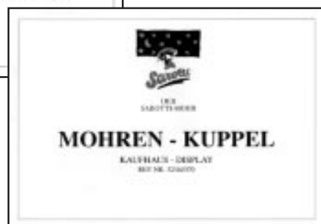
Aufkleber für Transportkiste